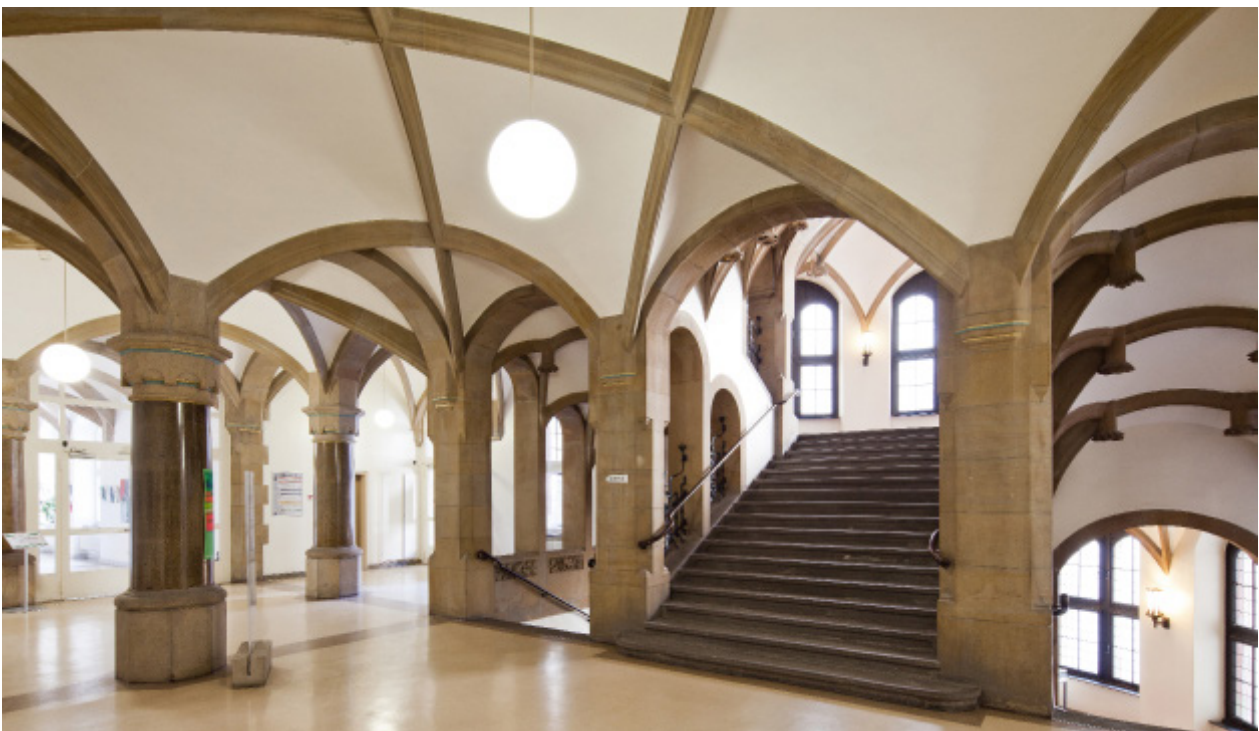
historisches rathaus wuppertal-elberfeld